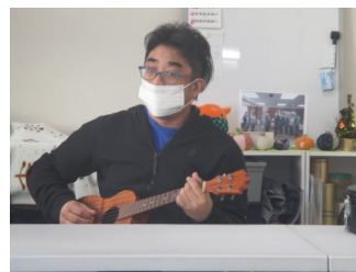
園部団長の「ウクレレ教室」の写真