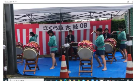
VSPの式典で太鼓を披露