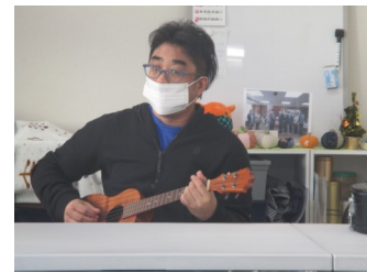
園部団長の「ウクレレ教室」の写真