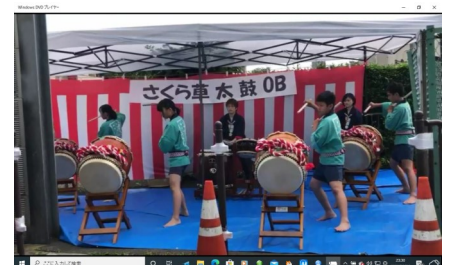
VSPの式典で太鼓を披露